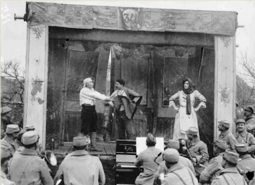
Réf. SPA 13 X 471, 4 mars 1916.

Mina Pawlowsky Lanau – Affiche. Recherches visuelles. Recherches sur Ballet Mécanique .